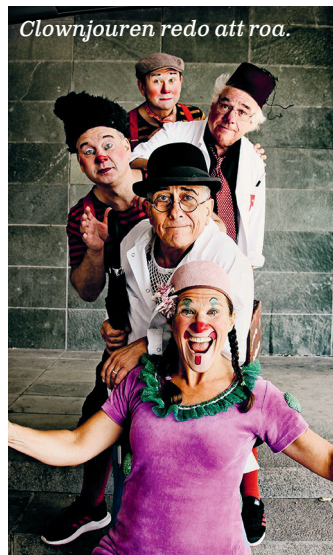
Clownjuren redo att roa.