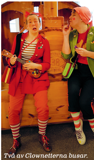
Två av Clownetterna busar.

Med sin yrkeskunskap, anpassningsförmåga och lyhördhet kan sjukhusclowner både roa en patient vid sängkanten och få en hel avdelning att skratta tillsammans.