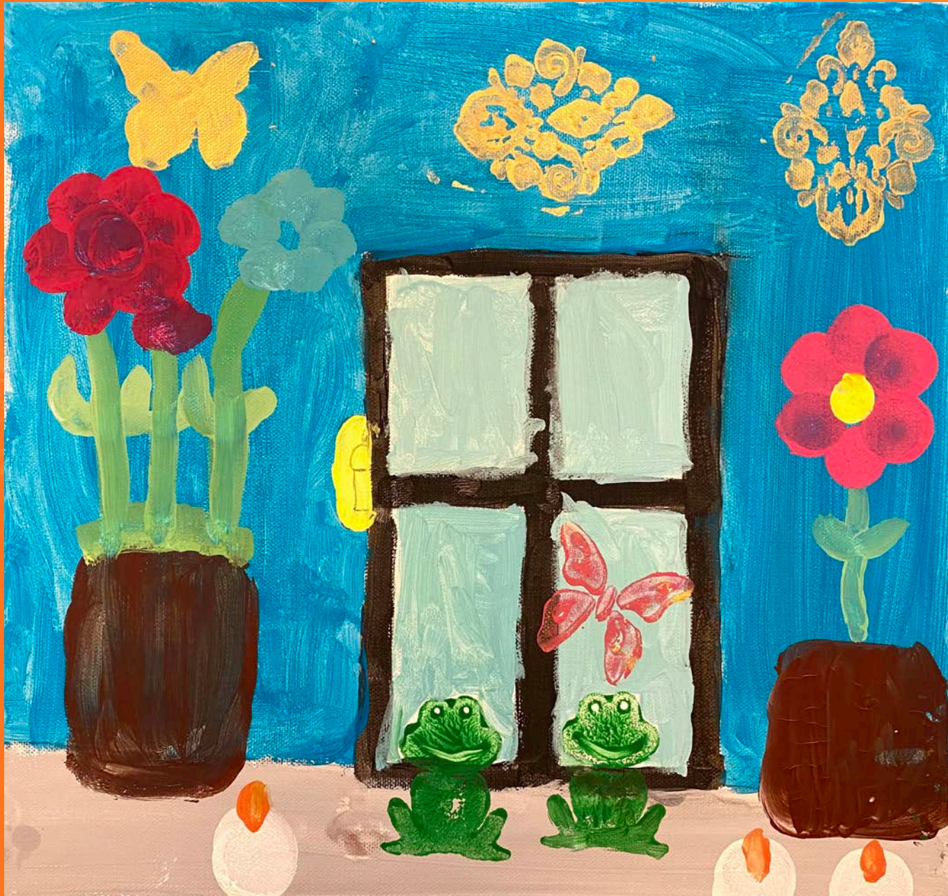
Ella, 7 år