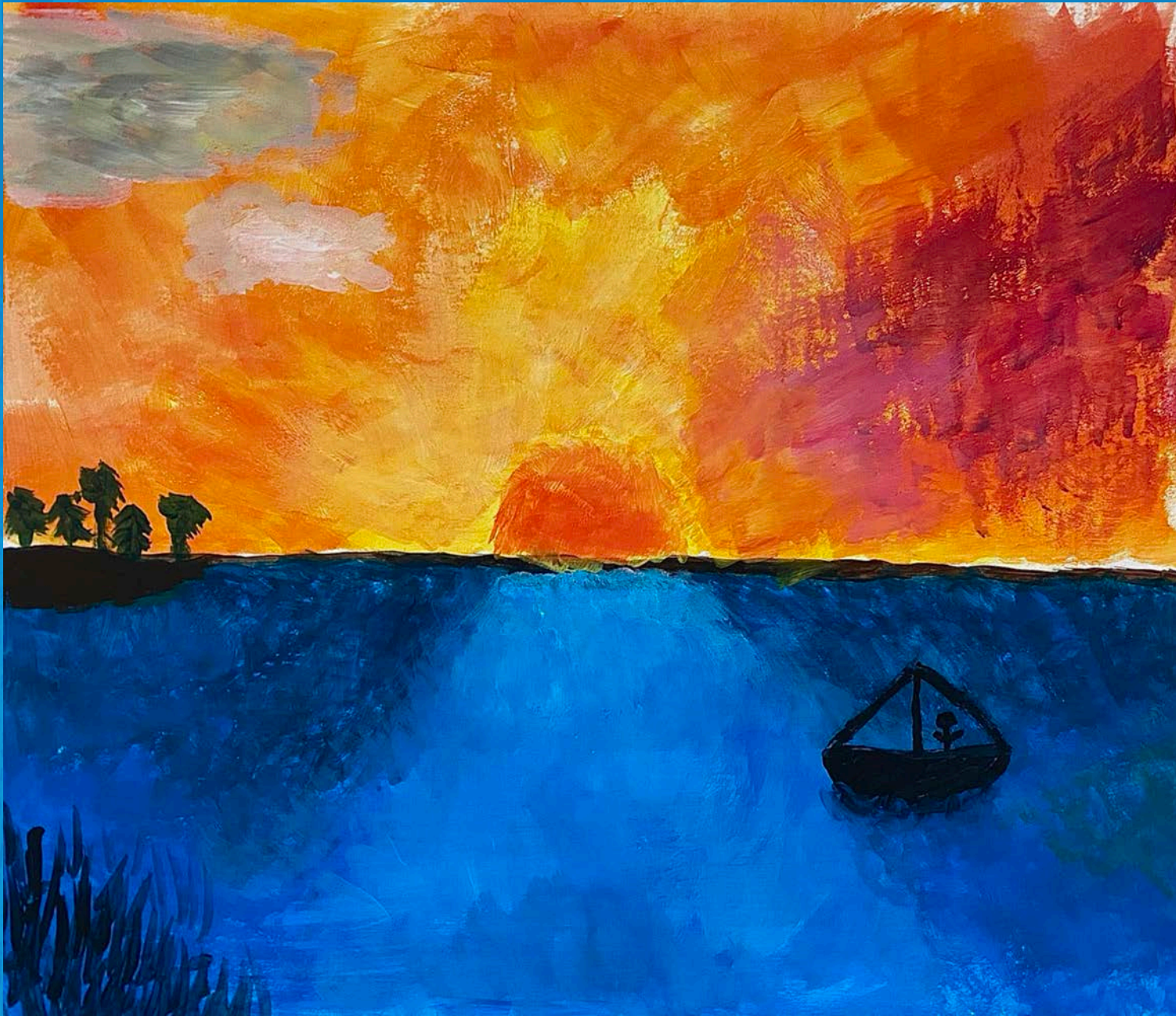
Linnea, 16 år